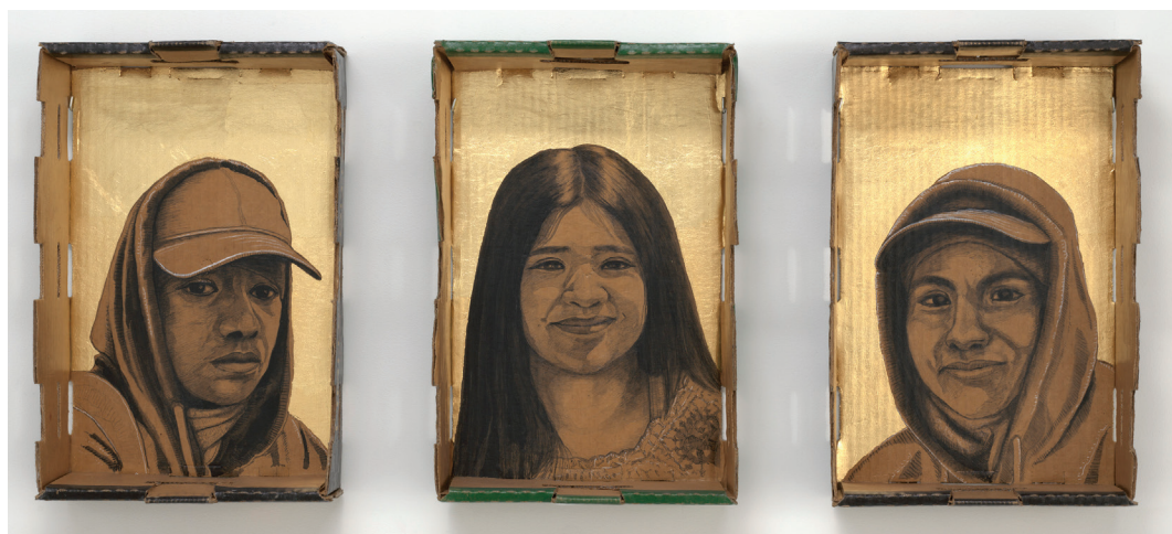
Narsiso Martínez (México-americano, nacido en 1977). Edición ilimitada, 2023 . Tinta, carbón, y hoja simple sobre cajas de bayas, 15 × 10 × 4 1/2 inches (38.1 × 25.4 × 11.4 cm) each. Colección Vilma Eid.

En el tríptico Edición ilimitada, 2023 , un retrato de una joven trabajadora agrícola aparece flanqueado de manera protectora por el de dos trabajadores mayores. Platicando sobre esta obra, Martínez comparte su esperanza para esta trabajadora joven—visualiza un futuro en el cual ella no tenga que trabajar en las huertas por décadas. 2 Martínez cree que la educación es el camino que esta joven debe seguir para no tener la vida ardua y agotadora de esos trabajadores mayores que están a su lado protegiéndola y guiándola. El rango de edades y las relaciones implicadas refuerzan la humanidad de estos figures, alentándonos a empatizar y relacionar con ellos, como lo hacen las obras de Martínez con frecuencia.