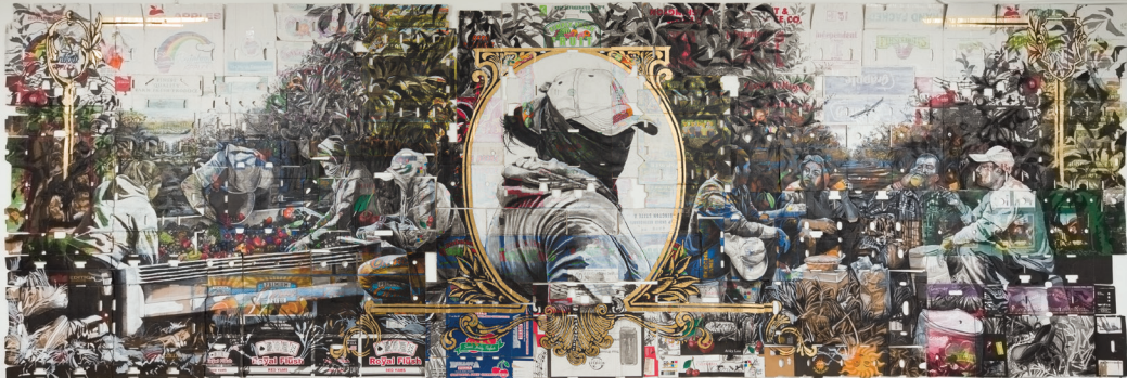
Narsiso Martinez (Mexican-American, born 1977). Always Fresh , 2018. Ink, charcoal, gouache, gold leaf, and collage on reclaimed produce boxes, 92 1/2 × 278 inches (235 × 706.1 cm)

industry, much like Golden Crop—No Pulp , 2023, and Portrait over Cuties II , 2023, each of which are rendered on boxes from widely recognizable brands.